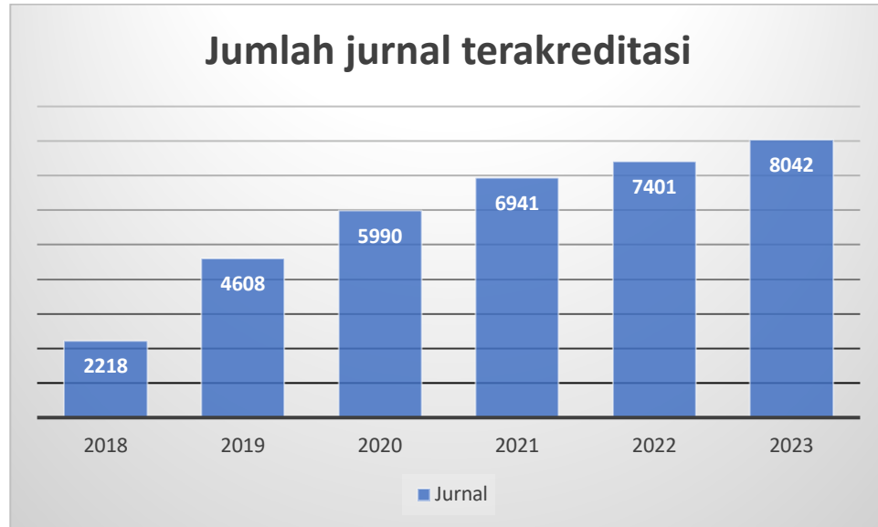
Gambar 1 Jumlah jurnal terakreditasi